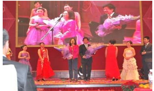
给董事长和林太献花