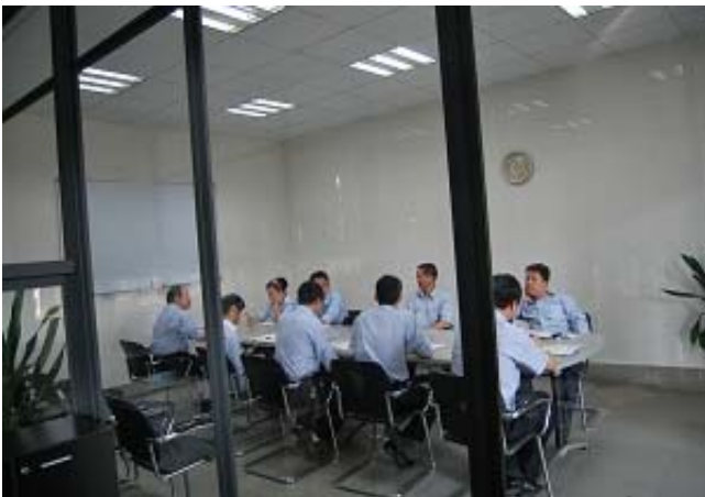
整洁舒适的办公室